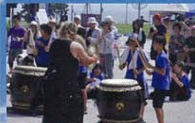
こども達も楽しめる