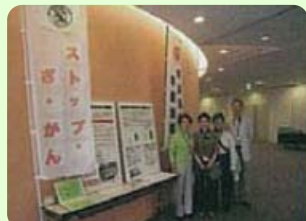
ハッピーマンマの手伝い