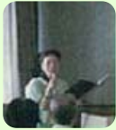
ストップざがん ボランティアの会 代表