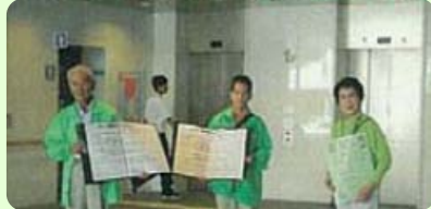
入口で 会場案内 をする仲間